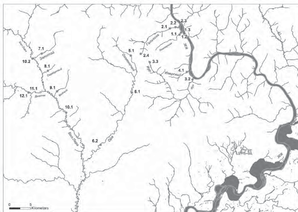
Рис. 1. Схема гидрографической сети обследованной территории с указанием станций отбора проб.

Ора, Джатва; три малых реки – Гальчиха, Каменушка, Иур, шесть ручьев – Иверский, Охотничий, Золотой, Серебряный, Медный, Николаевский (рис. 1). Сборы зообентоса в них были проведены 17–25 сентября 2013 г.